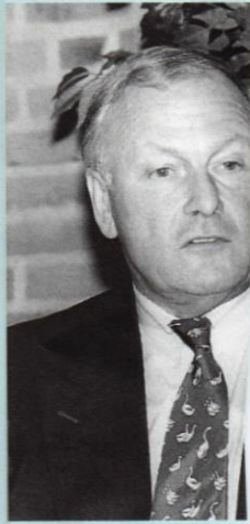
President-directeur Slecht Nederland

NCW georganiseerde, Bilderberg-conferentie. Vrijdag 24 en zaterdag 25 januari discussieerden enkele honderden genodigden over het onderwerp.