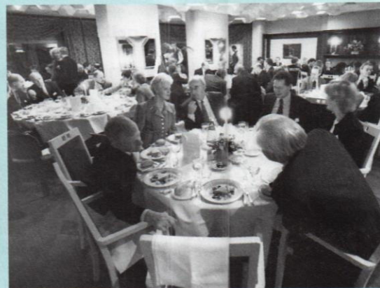
Diner op vrijdagavond