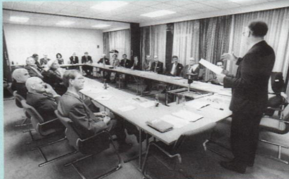
Op vrijdagmiddag gingen de deelnemers aan de Bilderberg-conferentie uiteen in tien workshops over thema's als 'Mensen in de marge, wat kan het bedrijfsleven daaraan doen?', 'Maatschappelijk handelen integreren in het bedrijfsproces', 'Ideëel bankieren' en 'Bedrijfsponsoring als vorm van maatschappelijke betrokkenheid'